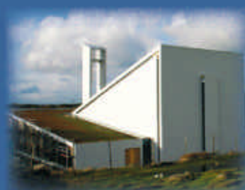
Frøyland og Orstad kyrkje