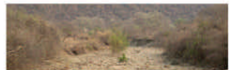
Det har vore tørke i Zambia og store delar av det sørlege Afrika sidan starten av 2024. Her ei uttørka elv i Gwembe.