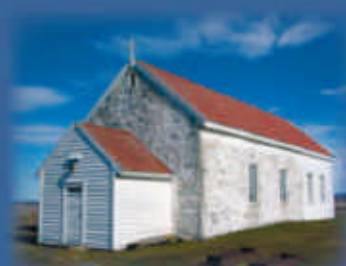
Orre gamle kyrkje